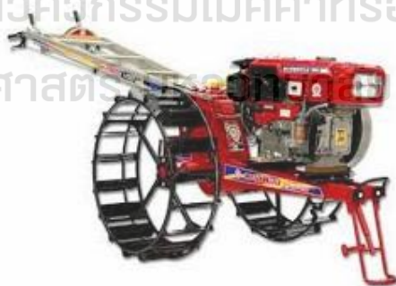
รูปที่ 1 รถไถเดินตาม

สำนักวิชาวิศวกรรมศาสตร์และเทคโนโลยีสุรนารี