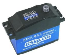
รูปที่ 4 Servo motor 65kg.cm

ทอร์ก T คือ ความพยายามของแรงที่จะหมุนวัตถุรอบแกนหรือจุดหมุนหรือก็คือ โมเมนต์ของวัตถุที่เคลื่อนที่แบบหมุน มีหน่วย N \cdot m เกิดจากผลคูณเชิงเวกเตอร์ของเวกเตอร์ตำแหน่ง r กับแรง F