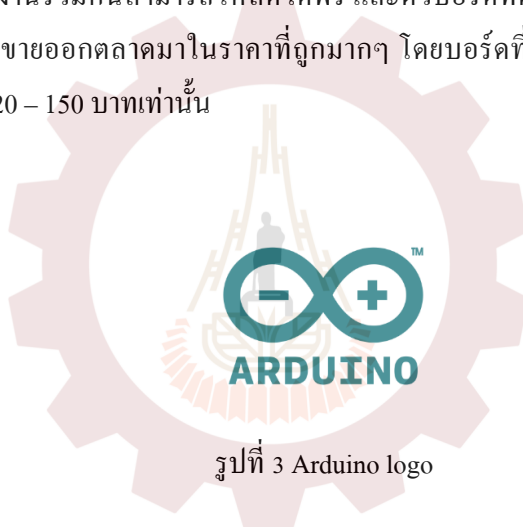
รูปที่ 3 Arduino logo

Arduino คือ โครงการที่นำชิปไอซีไมโครคอนโทรลเลอร์ตระกูลต่างๆ มาใช้ร่วมกันในภาษา C ซึ่งภาษา C นี้เป็นลักษณะเฉพาะ คือมีการเขียนไวยากรณ์ของ Arduino ขึ้นมาเพื่อให้การตั้งงานไมโครคอนโทรลเลอร์ที่แตกต่างกัน สามารถใช้งานโค้ดตัวเดียวกันได้ โดยตัวโครงการได้ออกบอร์ดทดลองมาหลายรูปแบบ เพื่อใช้งานกับ IDE ของตนเอง สาเหตุหลักที่ทำให้ Arduino เป็นนิยมมากเป็นเพราะซอฟต์แวร์ที่ใช้งานร่วมกันสามารถโหลดได้ฟรี และตัวบอร์ดทดลองยังถูกแจกแปลนทำให้ผู้ผลิตเงินนำไปผลิตและขายออกตลาดมาในราคาที่ถูกลงๆ โดยบอร์ดที่ถูกลงที่สุดในตอนนี้คือบอร์ด Arduino ที่มีราคาเพียง 120 – 150 บาทเท่านั้น