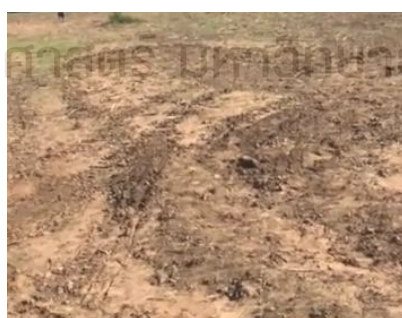
รูปที่ 6 รอยคราด