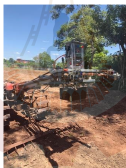
รูปที่ 5 ชุดควบคุมขณะติดตั้ง

รถไถมีความเร็ว 0.1 m/s ถึง 0.8 m/s สามารถคราดได้ระดับนิ่งตามมวลถ่วงที่ใส่ไปและในโหมดอัตโนมัติเกิด Error 3-4 เมตรและทำการทดลองในพื้นที่ขนาด 3 ไร่โดยมวลถ่วงที่ใส่ไปคือหินหนัก 5 กิโลกรัม